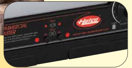
硬面包圈切換開關，單面或雙面 (祇限型號 TPT-230R-4)