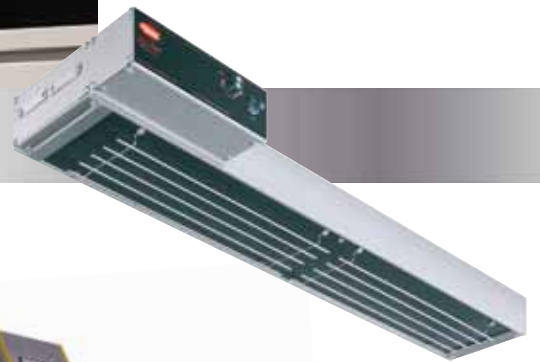
GRAIH-36 可選擇的TCBI控制盒 和金屬保護網